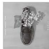
ユニバーサルミュージック / EMI Records 配信リリース

TVアニメ『忘却バッテリー』のオープニングテーマとして4月にリリースされた、Mrs. GREEN APPLEの配信シングル。楽曲は、テクニカルなギターとグルーブ感あふれるベースとドラムが印象的で、バンドとしての勢いを感じることができるエネルギッシュなもの。ピアノソロの演奏でも、バンドの雰囲気表現できるような演奏をぜひ。