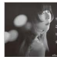
ポニーキャニオン PCCA-15031 (通常盤)

4月に公開された劇場版『名探偵コナン 100万ドルの五稜星(みちしるべ)』主題歌としてヒットしている、aikoの45枚目のシングルです。大ヒットシリーズとなっている劇場版『名探偵コナン』。本タイトルが27作目となり、今回の舞台は北海道の函館です。大切な人を想う歌詞とメロディは本作のストーリーを彩る素敵なナンバーとなっています。